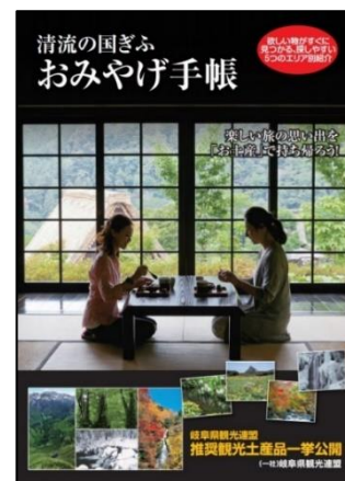
《清流の国ぎふ おみやげ手帳》

掲載内容：平成 27 年～平成 29 年度の特選推奨土産品を巻頭に 6 ページ掲載し、圏域毎に観光PRと推奨土産品を 掲載した。