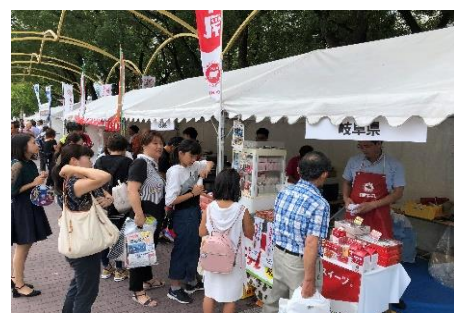
《ふるさと全国県人会まつり》