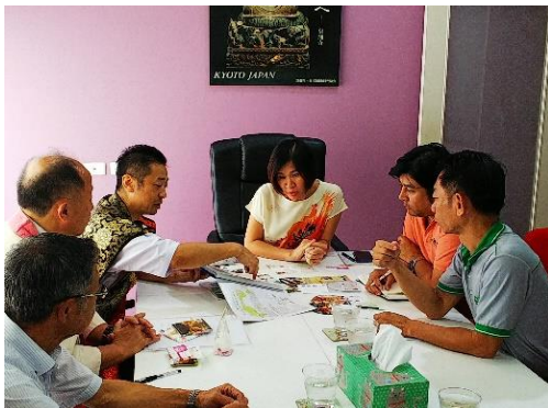
《セールスコール商談風景》