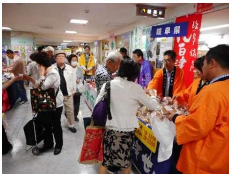
《全国センター合同物産展》