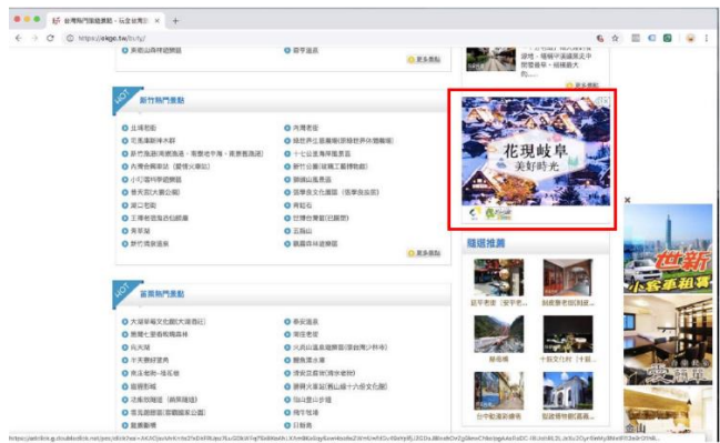
《RTB(Real Time Bidding) 上の掲載内容》