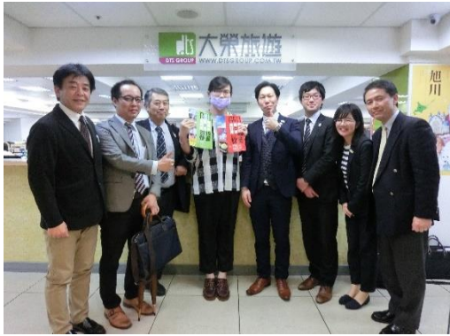
《セールスコール先での記念写真》