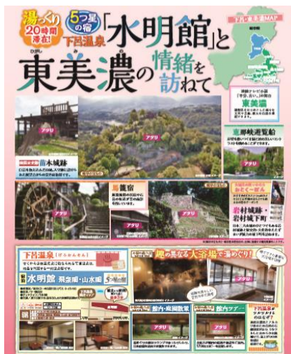
《新たに造成した旅行商品》