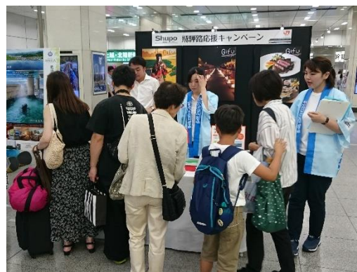
《イベント実施風景》