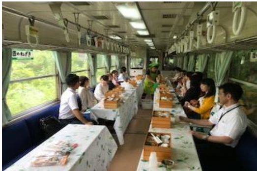
《東濃コース 明知鉄道寒天列車》