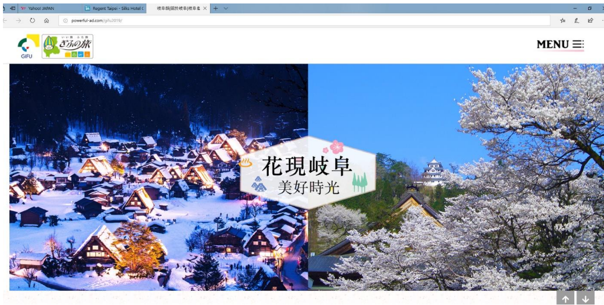
《岐阜県を特集する専用 Web サイト：タイガーエア台湾（台湾虎航）のホームページ上にバナー展開》