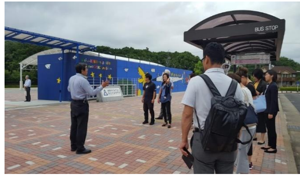
《西濃コース 岐阜かかみがはら航空宇宙博物館》