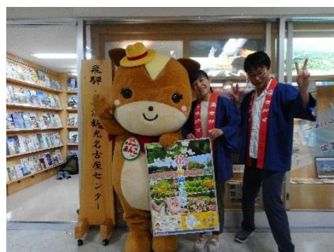
《メディア訪問 高鷲観光協会》