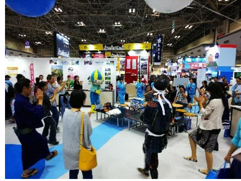
《一般来場者と共に郡上踊り》