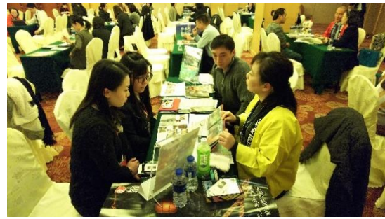
《東海地区観光セミナー・商談会での商談風景》