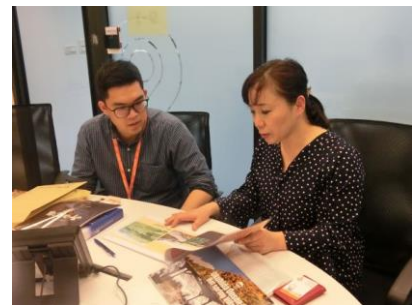
《雙獅聯合國際旅行社》