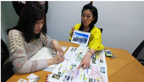
《セールスコールでの商談風景》