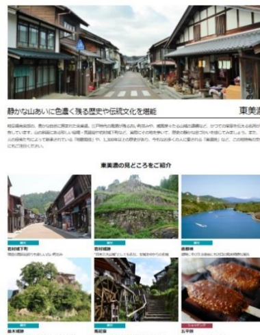
《特設ホームページ》