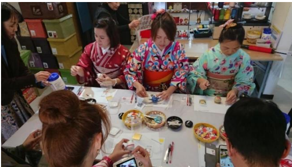
《美濃和紙起き上がりこぼし手作り体験》