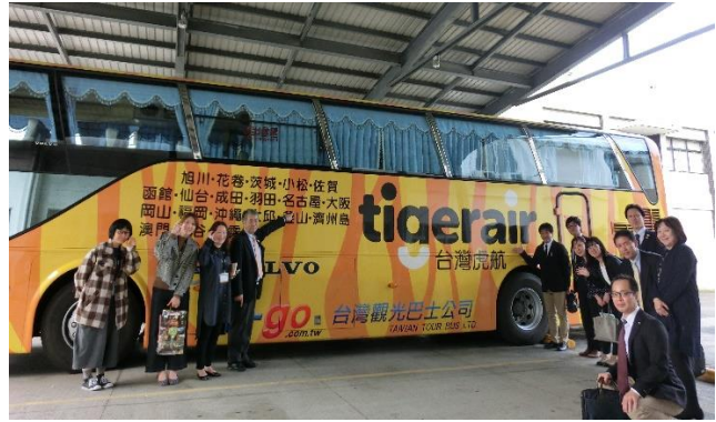
《台湾虎航（タイガーエア台湾）専用観光バス》