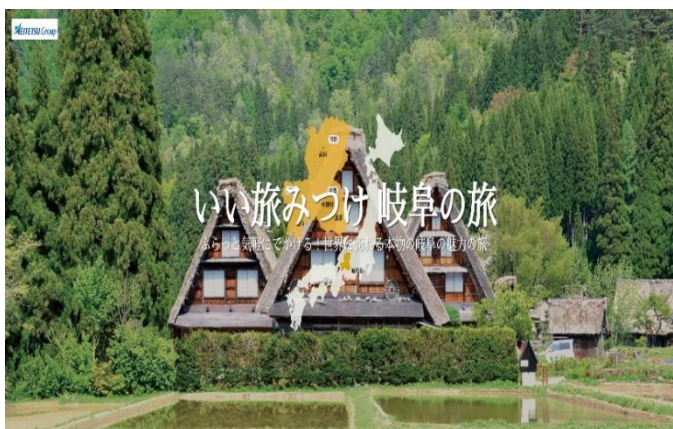
《特設ホームページ・名鉄観光サービス(株)》