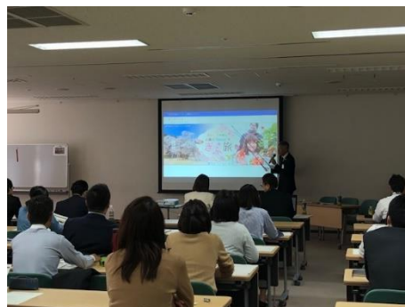
《情報発信事業説明会》