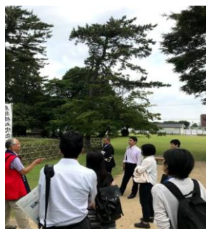
《徳川家康最後の陣跡》