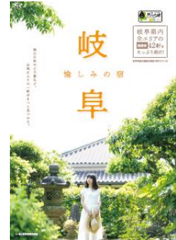
《宿泊ガイドブック》