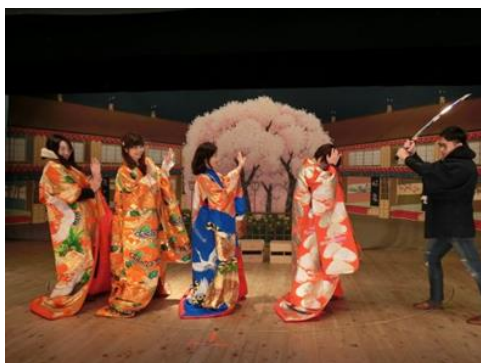
《地歌舞伎舞台体験（中津川市・常盤座）》