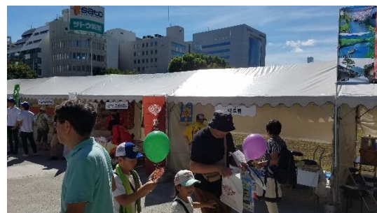
《ふるさと全国県人会まつり》