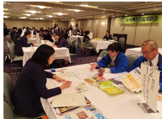
《県内団体の積極的な売り込み》