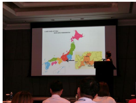
《観光セミナーの様子》