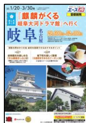
J T B

「ぎふ戦国きっぷ」「川原町まちあるきクーポン」を加えた、新幹線・宿泊を組み合わせた首都圏・関西圏発の旅行商品造成を働きかけた結果、大手5社が造成