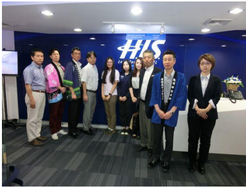
《H. I. S. バンコク支店商談後の記念写真》