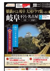
ジェイアール東海ツアーズ