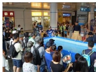
《7/21 関市観光協会「小瀬鶺鴒」実演》