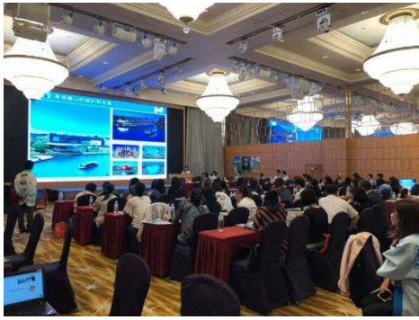
《広域観光商品提案会の様子》