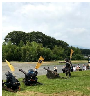
《鉄砲隊の実演・見学》

西濃コース：関ヶ原古戦場 笹尾山など、関ヶ原歴史民俗資料館、妙應寺、レスト関ヶ原、明智光秀ゆかりの地・大垣市上石津郷土資料館、奥の細道むすびの地記念館など。