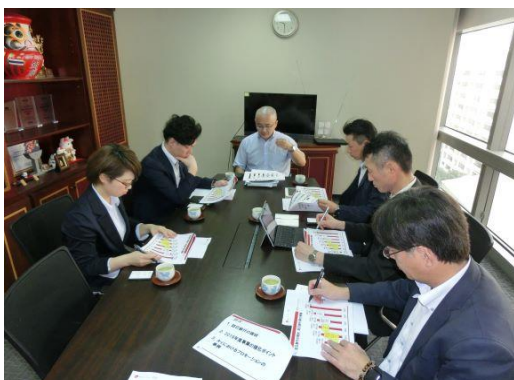
《JNTOバンコク事務所での最新情報聴講》