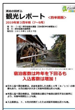
《岐阜県観光レポート四半期版》