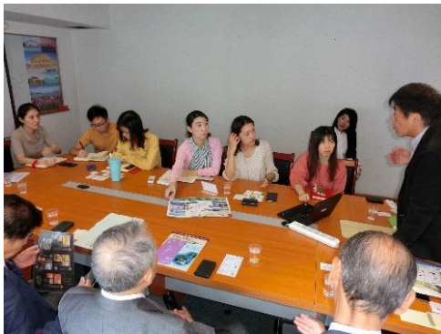
《広州広之旅国際旅行社での商談風景》