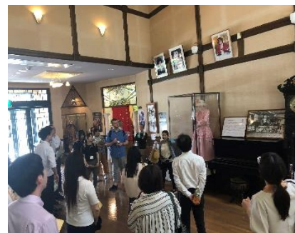
《恵那市明智町 大正浪漫館》