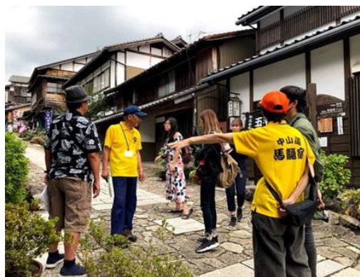
《馬籠での視察風景（9月）》