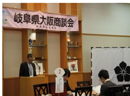
《岐阜県観光企画課からの説明》