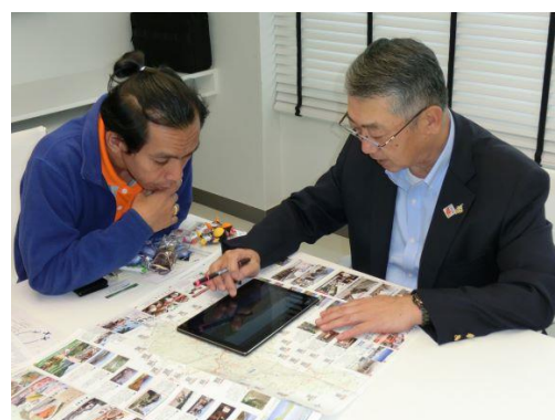
《S. M. I. (Wendy Tour)社での商談風景》