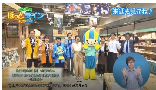
《6/13 岐阜県政ほっとライン (岐阜放送)》