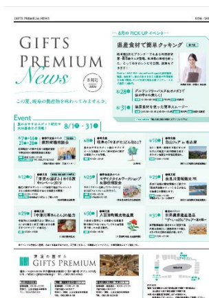
《ギフトプレミアムニュース》