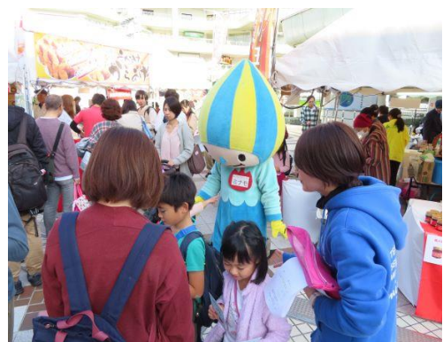
《物販ブースの賑わいとミナモ》