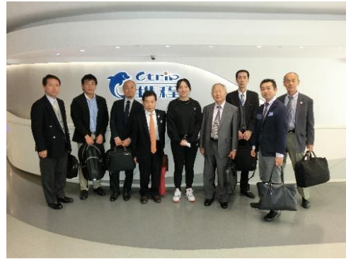
《上海携程国際旅行社(Ctrip)訪問》