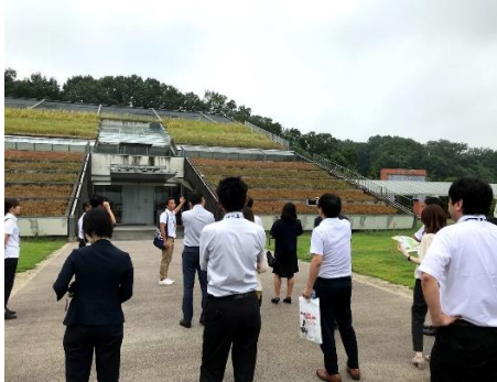
《大河ドラマ館(予定)前》