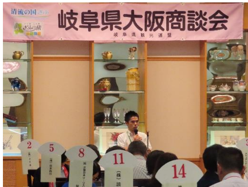
《大河ドラマ館など武将観光について説明》