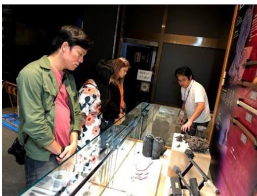
《関鍛冶伝承館での視察風景（9月）》