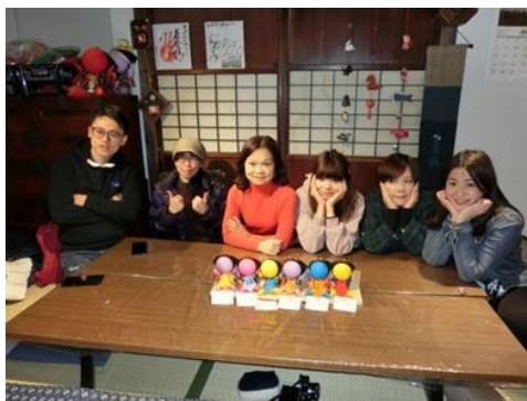
《さるぼぼ手作り体験（高山市）》