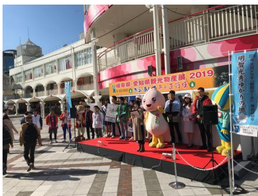
《2019 オープニングの様様》