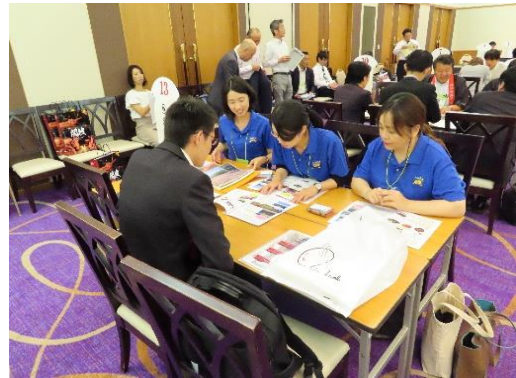
《県側から旅行会社へ 提案風景》