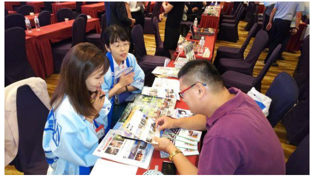
《商談会の様子（岐阜県ブース）》