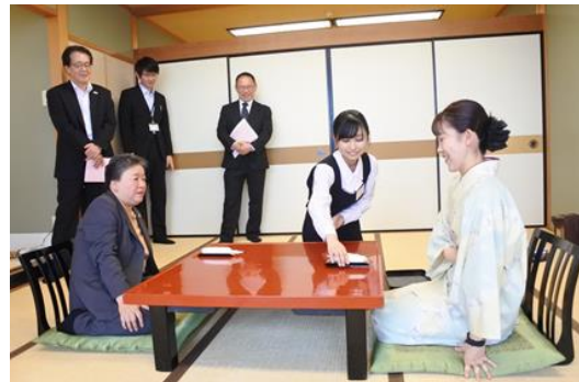
《おもてなし研修 実技》