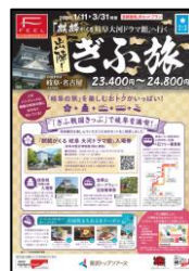
東武トップツアーズ