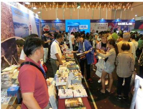
《FEEL JAPAN 2019 会場内の賑わい》