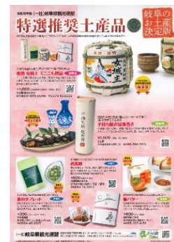
《特選推奨土産品のチラシ》