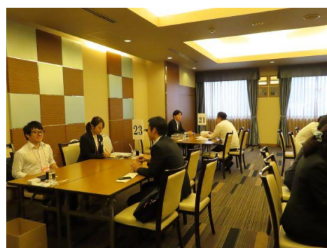
《盛況により商談会場を2会場で運営した》