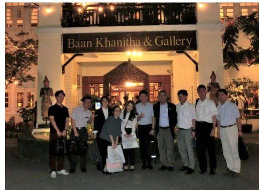
《夕食交流会後の記念写真》