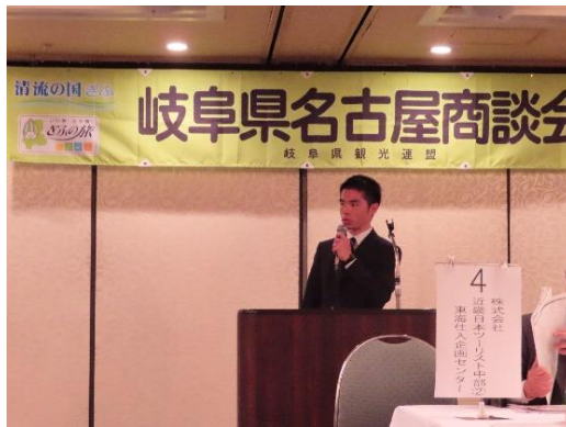
《県から岐阜県戦国武将観光を説明》