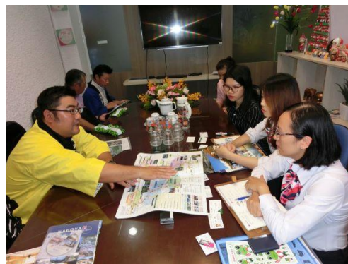
《セールスコールで自社をPR》