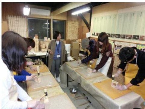
《木マス手作り体験（大垣）》