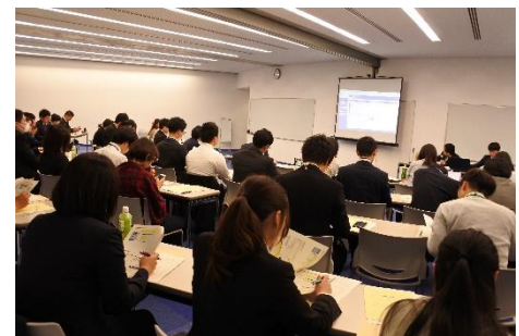
《情報発信事業説明会》