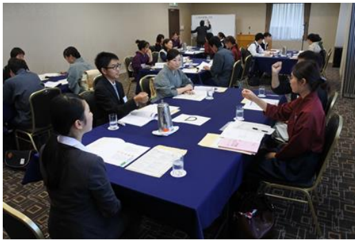
《おもてなし研修 座学》