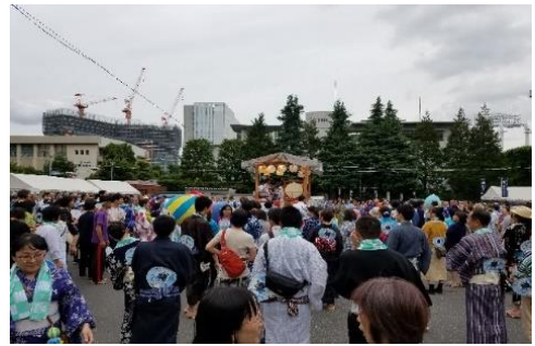
《郡上おどり in 青山》

首都圏からの更なる誘客を促進するため、県や市町村と連携した観光物産展に出展した。