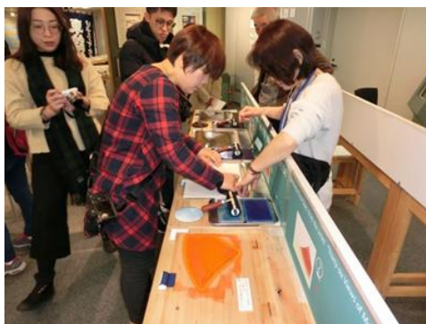
《浮世絵重ね摺り体験（恵那市）》