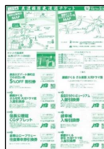
《パンフレット・割引クーポン》