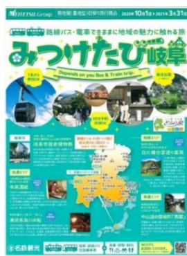
専用パンフレット