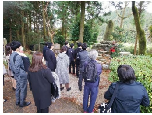
笹尾山の石田三成陣跡(左)と島津義弘陣跡(右)にて史跡ガイドの案内を聞く参加者