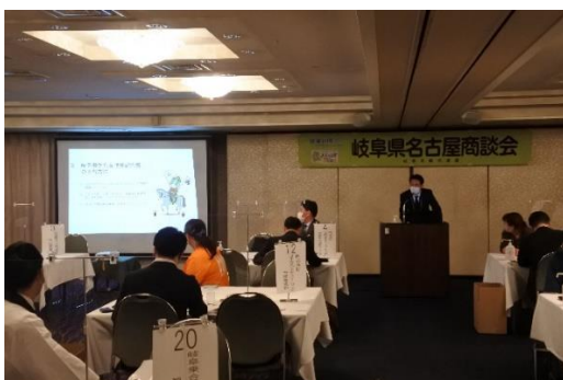
《岐阜関ヶ原古戦場記念館を説明》