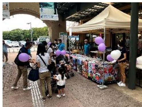
《岐阜県・愛知県合同観光PR展》