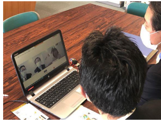
事務局指定のオンラインシステム・Cisco社「Webex」を使用している商談の様相