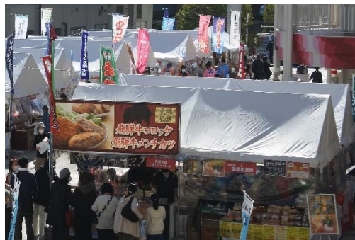
《物販ブース等の賑わい》