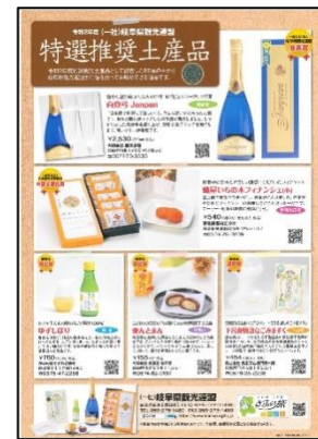
《特選推奨土産品チラシ》