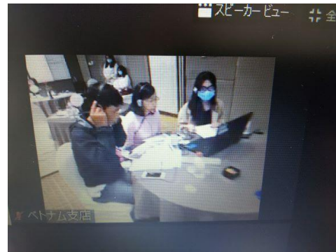
現地・ホーチミン会場の商談風景

②本来実施を予定した他事業（下記参照）については、いずれもコロナ禍のため中止となった。