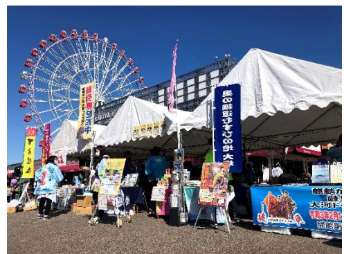
《刈谷ハイウェイオアシスでの観光PR展》