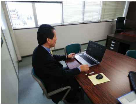
Google Meetを活用しての商談

1セッション15分間の商談を9セッションで計90商談を実施。日本側参加者は最低5社と商談した。