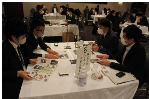
《県内団体の積極的な売り込み》