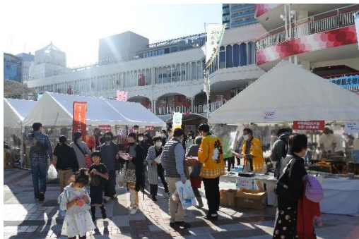
《せんちゅうパル 会場風景》