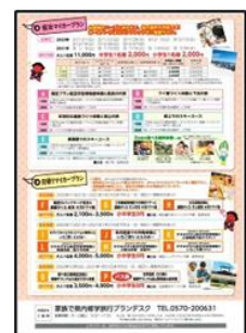
《小中学生に配布したチラシ》