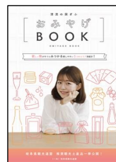
《観光土産品ガイドブック》