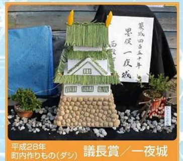
平成28年 町内作りもの(ダシ) 議長賞 / 一夜城

ふれあいクリーン作戦ボランティア募集中 【問合せ先】墨俣地区社協 ☎0584-62-3116