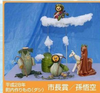
平成28年 町内作りもの(ダシ) 市長賞 / 孫悟空