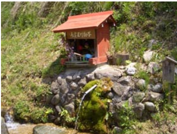
↑休憩場所での湧き水（イメージ）