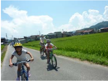
↑サイクリング（イメージ）