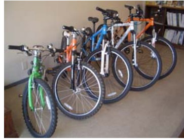
↑使用マウンテンバイク（イメージ）