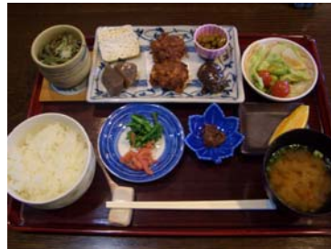
↑地産地消ランチ（イメージ）