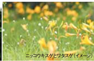
ニッコウキスゲとワタスゲ(イメージ)