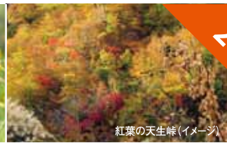
紅葉の天生峠(イメージ)