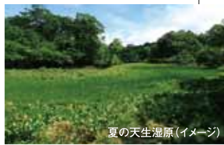
夏の天生湿原(イメージ)