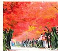
谷汲山参道の紅葉