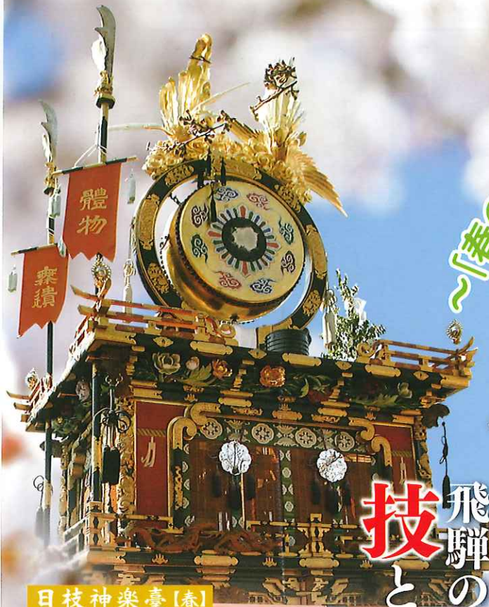
日枝神樂臺【春】 ひえかぐらたい