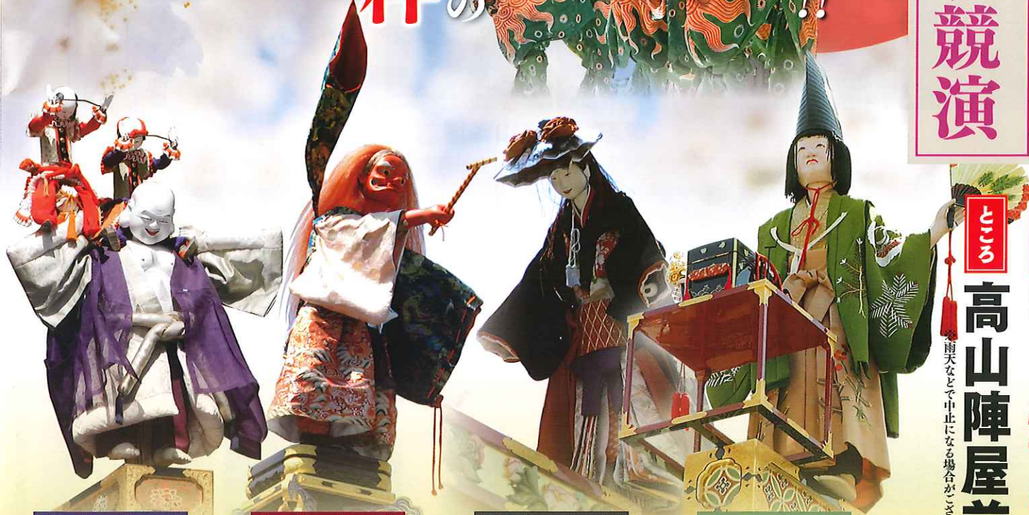
布袋臺【秋】 ほていたい