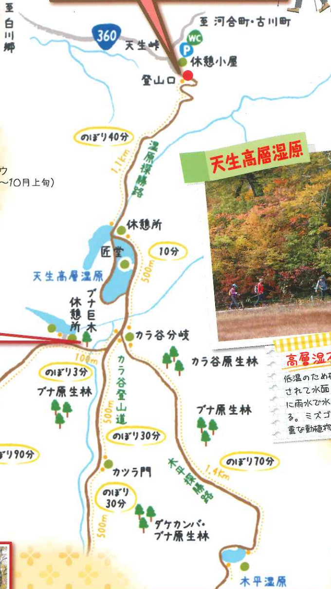
エゾリンドウ (9月上旬~10月上旬)