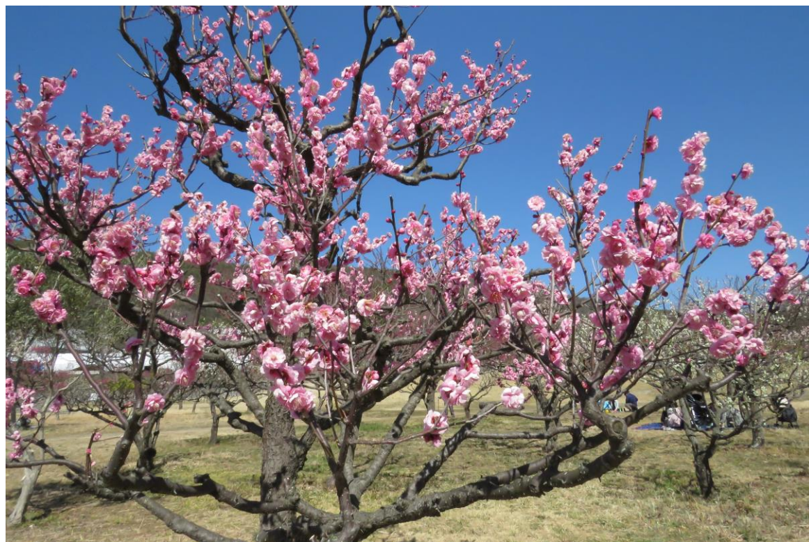
蘇原自然公園（各務原市）