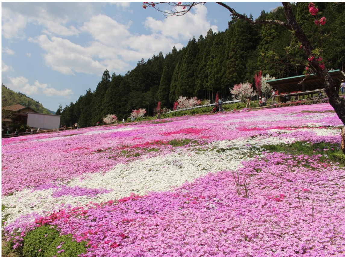
國田家の芝桜（郡上市）