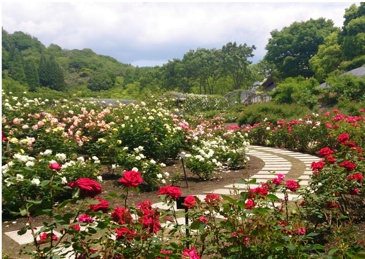
ぎふワールド・ローズガーデン（可児市）