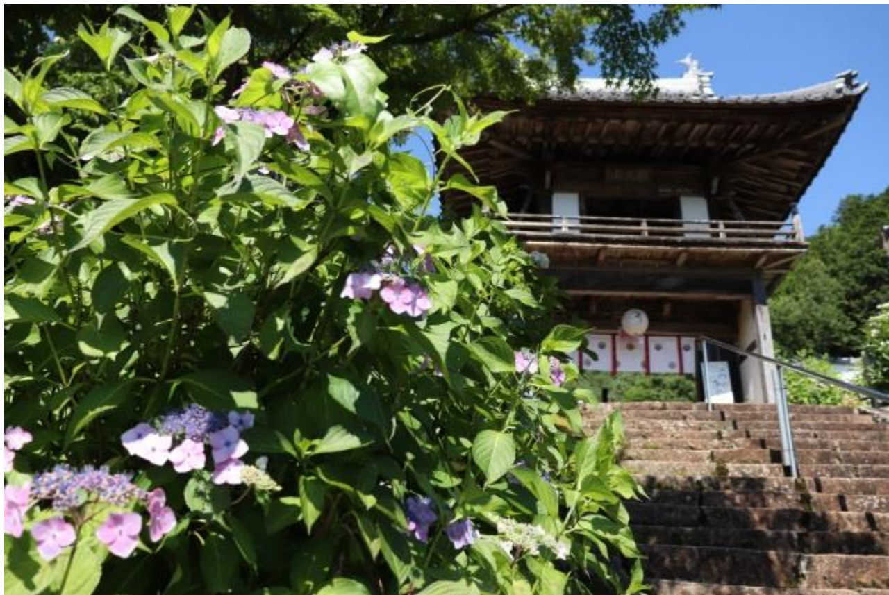
三光寺の山あじさい（山県市）