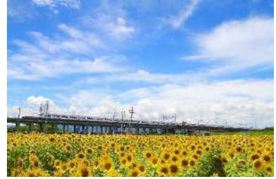
「走れ！夏列車。」 大垣ひまわり畑 (大垣市) 石黒義章