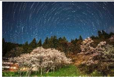
「煌めく臥龍桜」 臥龍桜 (高山市) 小島正博