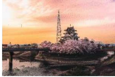
「染まる一夜城」 墨俣一夜城 (大垣市) 井上 翔太