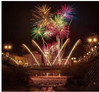
「澄みきった夜空に映える 冬花火」 下呂温泉花火物語 (下呂市) 宮脇 淳