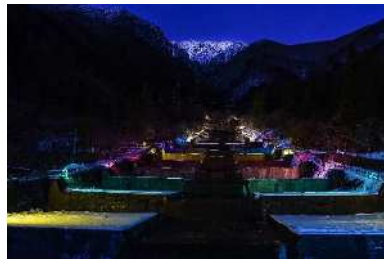
「彩りの奥飛騨温泉郷」 栃尾温泉洞谷雪桜ライトアップ (高山市) 杉谷尚巳