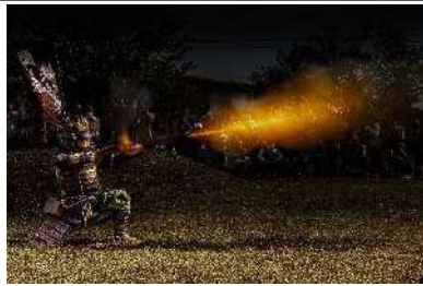
「関ヶ原鉄砲隊、大筒の咆哮」