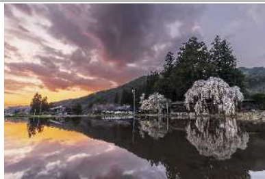
「高山 春の夕暮れ」 青屋神明神社 (高山市)