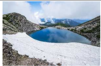
「蒼い瞳」 翠ヶ池 白山山頂 (白川村) Taka