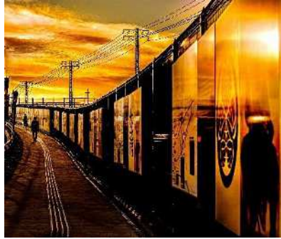
「the time of glow~時空を超える旅」