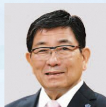
古田 肇 (ふるた はじめ) 岐阜県知事