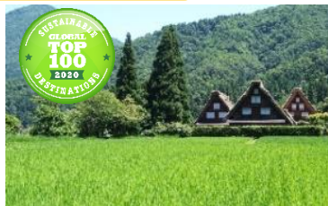
世界遺産「白川郷合掌集落」