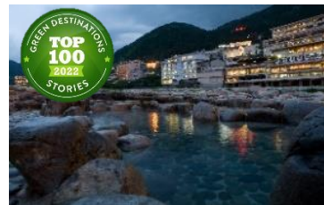
下呂市・下呂温泉