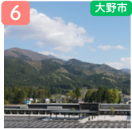
道の駅 越前おおの 荒島の嶺