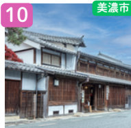
旧今井家住宅・美濃史料館