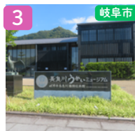
長良川うかいミュージアム