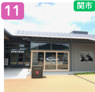
せきてらす (岐阜関刃物会館)