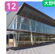
道の駅パレットピア おおの

お出かけの際は、 事前に現地の道路状況をご確認 いただくとともに、各施設の ホームページ等で定休日や営業 時間をご確認ください。