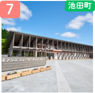
道のオアシス フォーシーズンテラス