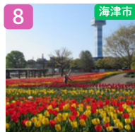
木曾三川公園センター