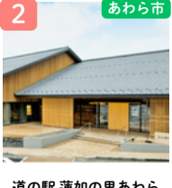
道の駅 蓮如の里あわら