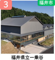
福井県立一乗谷 朝倉氏遺跡博物館