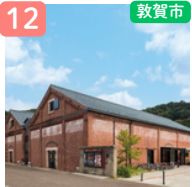
敦賀赤レンガ倉庫