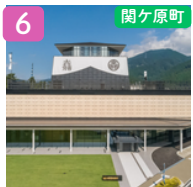
岐阜関ヶ原古戦場記念館