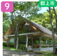
古今伝授の里 フィールドミュージアム