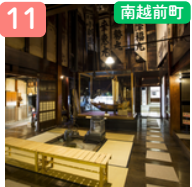
北前船主の館 右近家